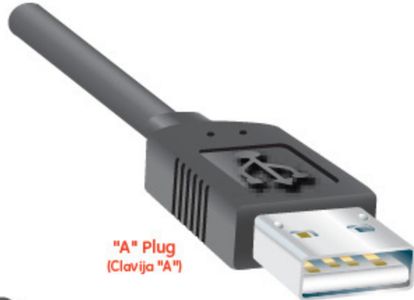
"A" Plug (Clavija "A")

This high quality GE USB 2.0 Mini Device Cables is fully compatible with most USB mini devices (USB 1.1 and USB 2.0). USB Device Cables interface USB ready computers to USB devices (peripherals) such as digital cameras, MP3 players, PDAs, or other portable devices.