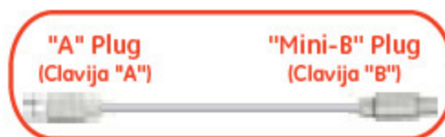
USB 2.0 Mini Device Cable El Cable mini del Dispositivo