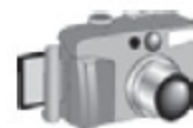
Portable USB Device with 5-Pin Mini-B plug (El Dispositivo portátil de USB con tapón de B Mini de 5 Alfileres)