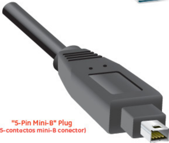
"5-Pin Mini-B" Plug (5-contactos mini-B conector)

This high quality GE USB 2.0 Mini Device Cables is fully compatible with most USB mini devices (USB 1.1 and USB 2.0). USB Device Cables interface USB ready computers to USB devices (peripherals) such as digital cameras, MP3 players, PDAs, or other portable devices.